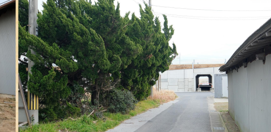
このトンネル抜けると すぐ海です