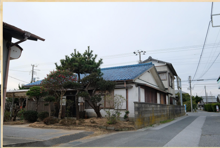
建物の使用には、修繕が必要です。