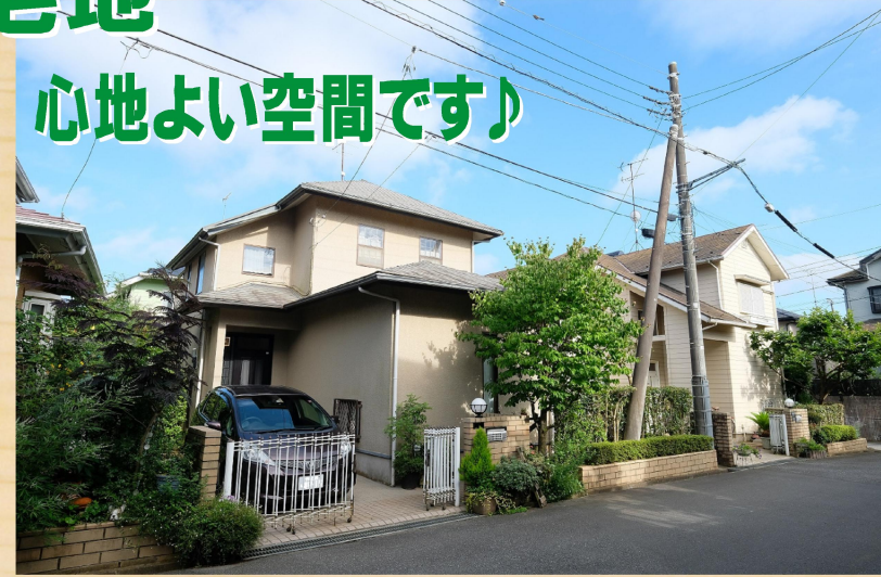
設備・条件：上下水道 / 集中プロパン