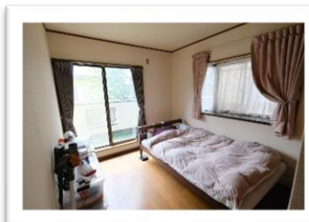
2面採光 明るい2階洋室