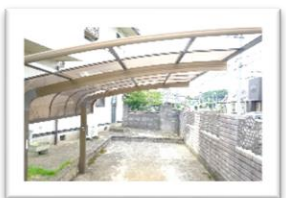
★カーポート付き駐車場★