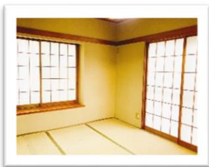
2面採光 お庭に面した明るい和室