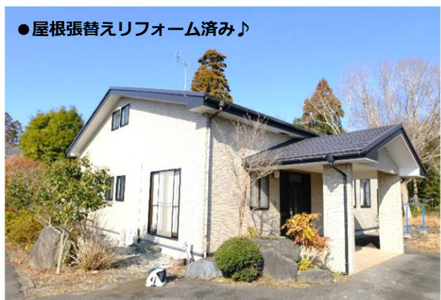
●屋根張替えリフォーム済み♪