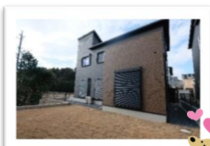
愛犬も喜ぶお庭の広さ