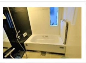
スタイリッシュな浴室