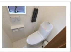
白を基調にした清潔なWC