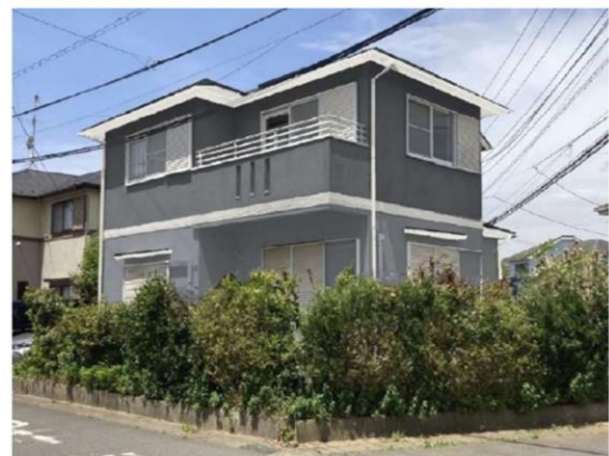
全面道路ゆったり6m