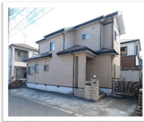
駐車スペース3台可（軽自動車含む）