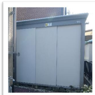
収納豊富な物置付き！